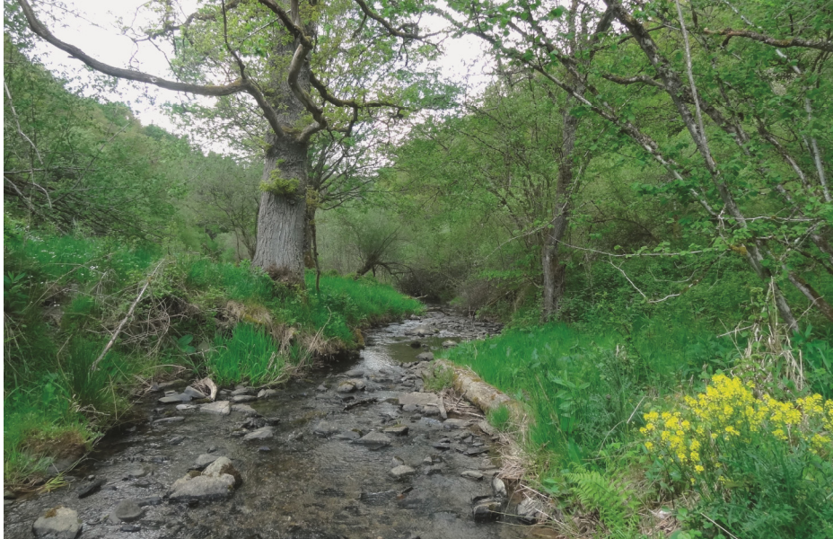
Abb. 3: Seit 2017 ist Bsal an Feuersalamandern des Sauerbachs im Nationalpark Eifel nachgewiesen (21.5.2015).

In 2017 Bsal was detected on fire salamanders of the Sauerbach/Eifel National Park.