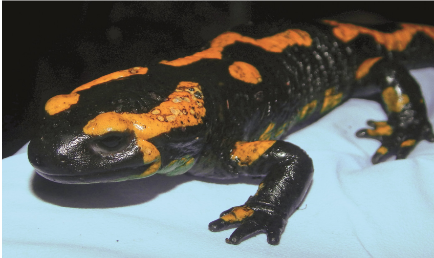
Abb. 1: Bsal -infizierter Feuersalamander mit den charakteristischen Haut-Läsionen. Foto: T. Rautenberg, Waldfriedhof Essen, 5.1.2018).

Fire salamander, infected with Bsal with characteristic skin lesions (city of Essen, North Rhine-Westphalia).