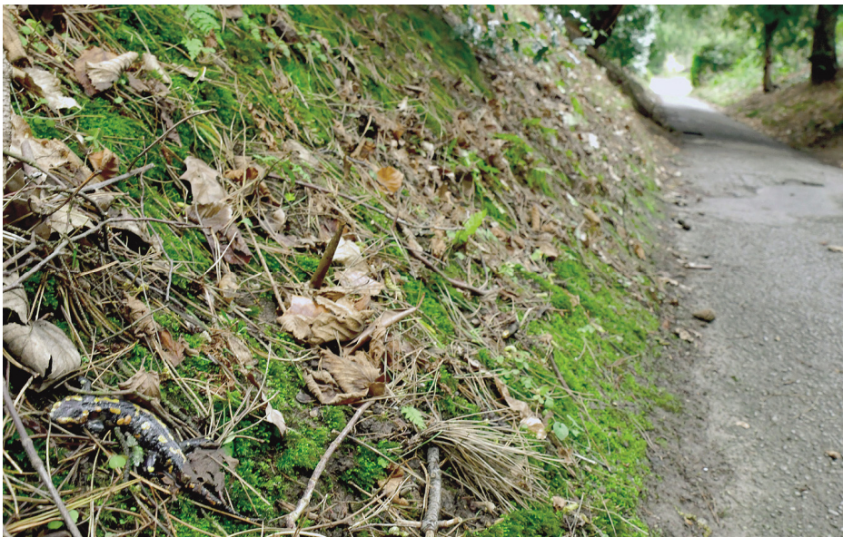
Abb. 4: In Essen hat Bsal inzwischen an mehreren Stellen zu Massensterben von Feuersalamandern geführt, so auf dem Südwestfriedhof Essen-Fulerum. Der tote Feuersalamander unten links an der Böschung zeigt die Original-Fundsituation. Foto: M. Vences, 3.2.2018.

In 2017 Bsal was detected on fire salamanders of the Sauerbach/Eifel National Park.