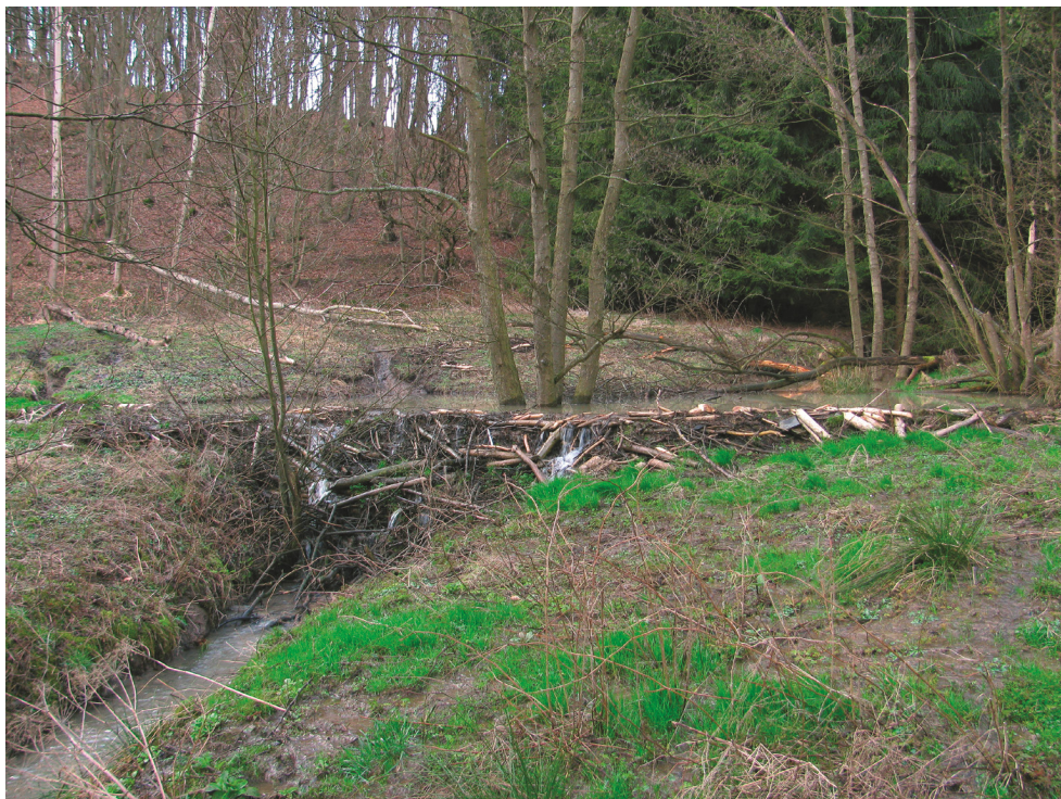
Abb. 7: In den Quellbächen der Nordeifel haben Biber inzwischen mehrere 100 Teiche gebaut, in denen sich große Molch- und Feuersalamander-Populationen etablieren. Deren Zukunft ist angesichts der Salamanderpest ungewiss, wie hier im Kalltal, Kallerbach.