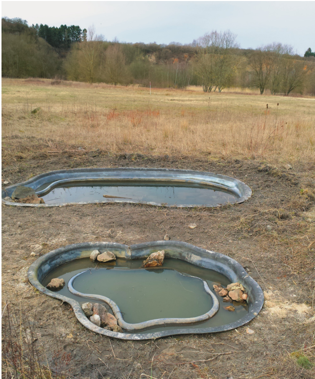
Abb. 5: Der Brockenberg bei Stolberg, StädteRegion Aachen beherbergt eine der letzten Gelbbauchunken- ( Bombina variegata) Populationen NRWs. 2016 wurde Bsal an einem Teichmolch nachgewiesen, 2017 waren fast alle beprobten Teich-, Faden- und Kammolche infiziert; vom Bergmolch fanden wir nur noch tote Tiere.

The Brockenberg near Stolberg (North Rhine-Westphalia) is the habitat of several endangered amphibian species such as Bombina variegata and Triturus cristatus . In 2016 Bsal was detected on a common newt, 2017 almost all sampled common-, palmate- and crested newts were infected, the alpine newts found were all dead.